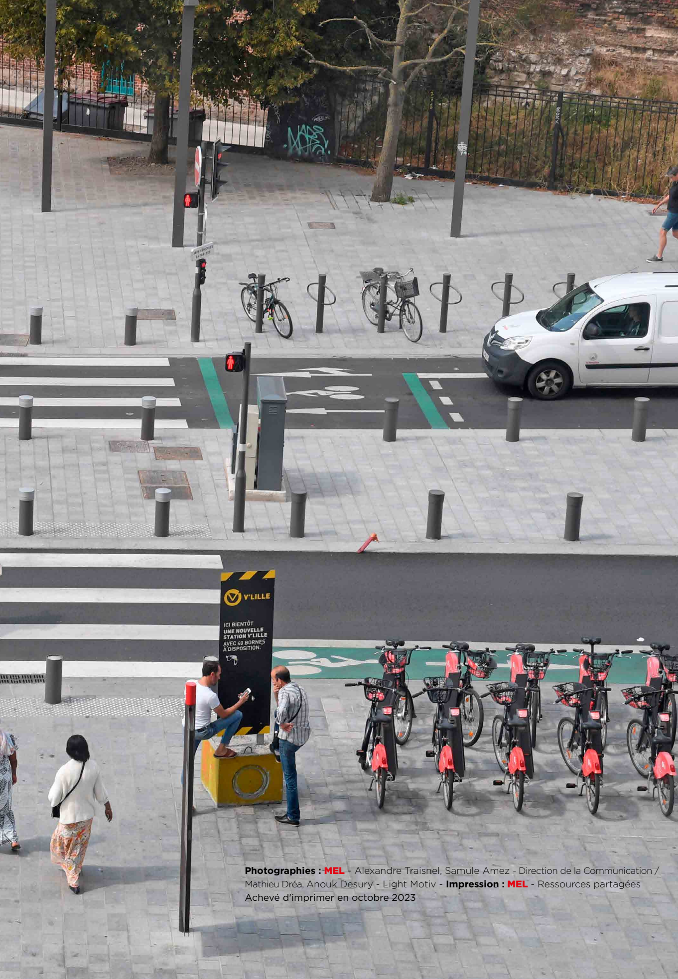
Impression : MEL - Ressources partagées Achévé d'imprimer en octobre 2023