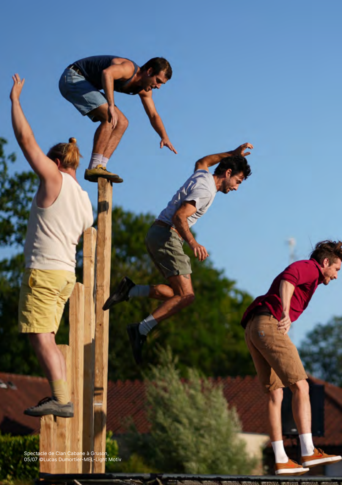
Spectacle de Clan Cabane à Gruson, 05/07