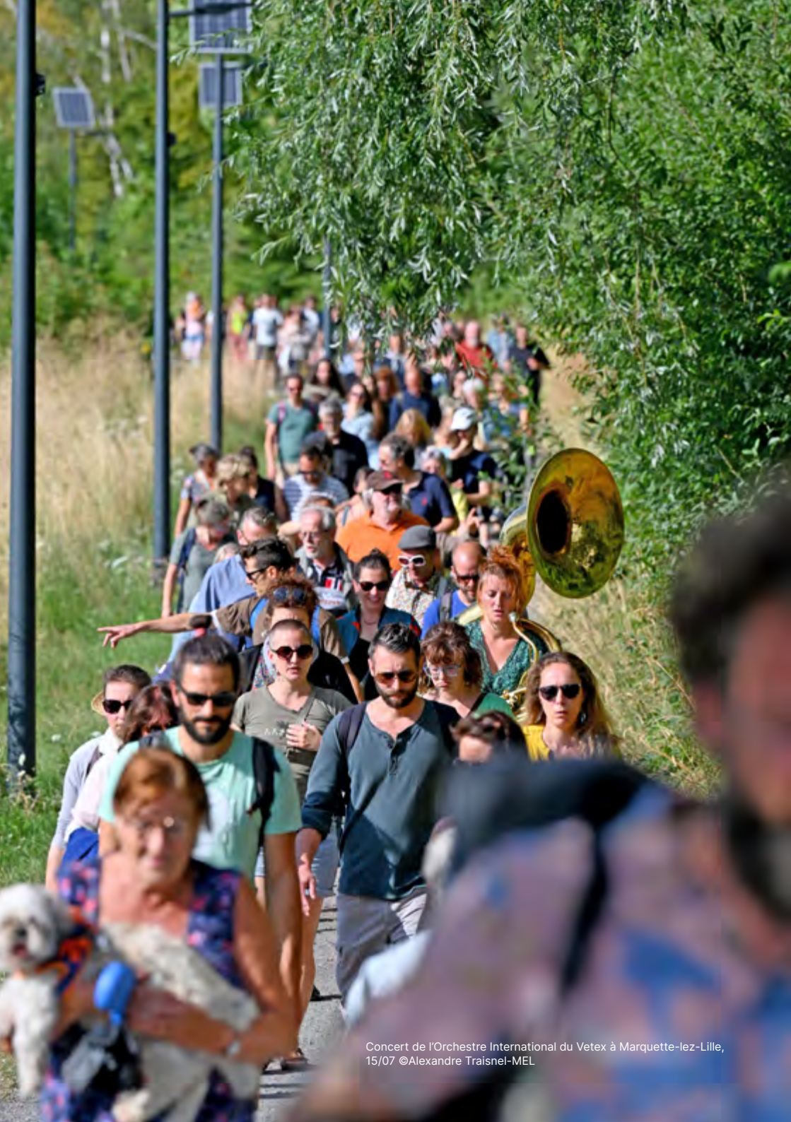
Concert de l'Orchestre International du Vetex à Marquette-lez-Lille, 15/07