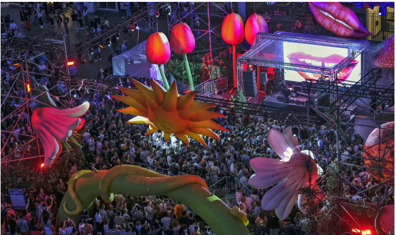
Une Métropole vivante, attractive et dynamique - Parade Lille3000, 2022