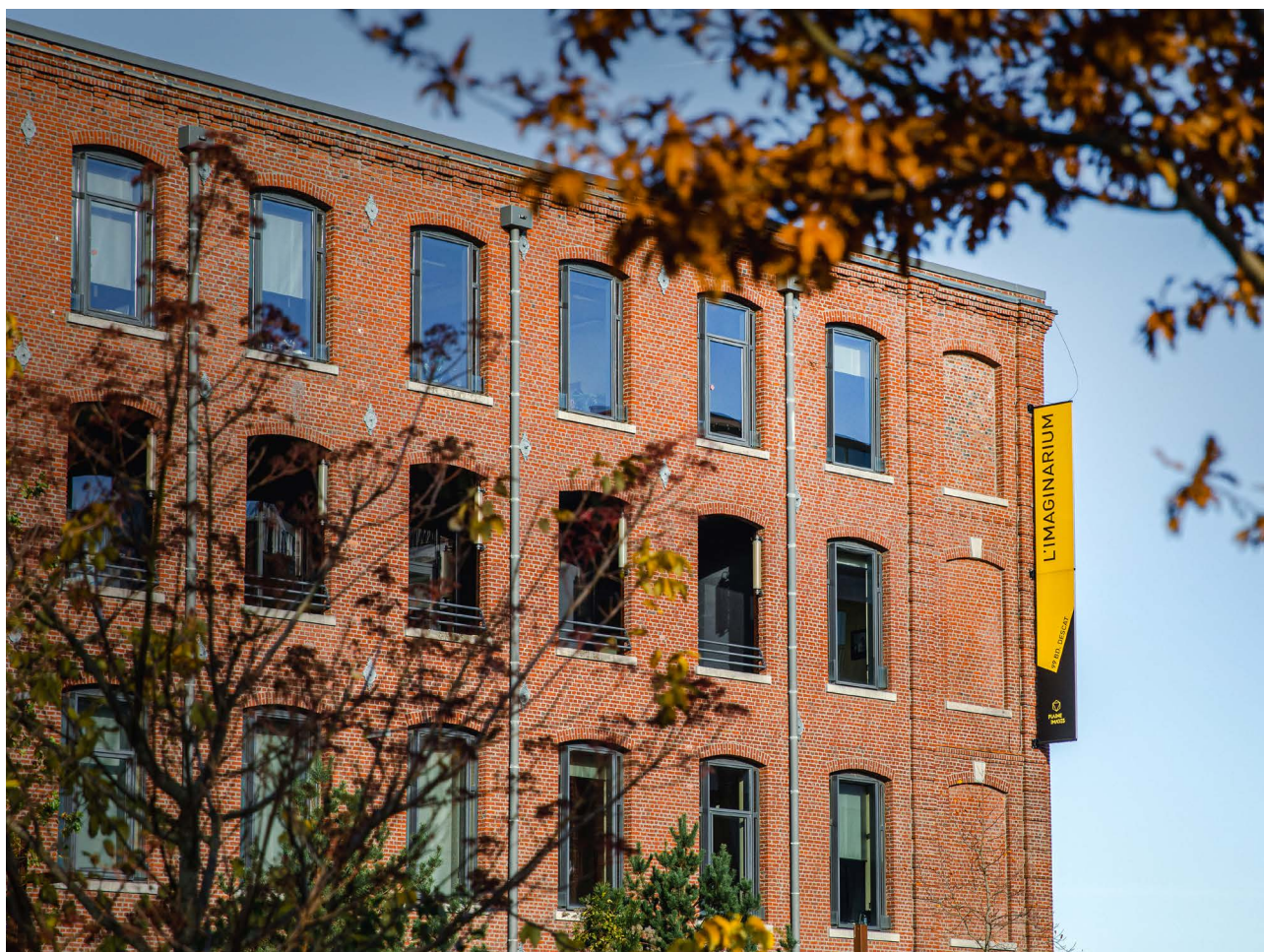
L'Imaginarium, bâtiment totem du futur site d'excellence métropolitain situé sur le site de la Plaine Images

En 2007, la MEL a confié à la SEM Ville Renouvelée la réalisation de ces deux ambitions dans le cadre d'une concession d'aménagement (avec une participation MEL de 225 M€) et d'un rôle d'opérateur pour favoriser l'émergence de la filière des Industries Culturelles et Créatives (1,35 M€ chaque année).