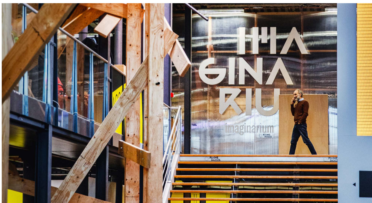
L'Imaginarium à la Plaine Images

Aujourd'hui, la filière ICC fait partie des filières d'excellence de la MEL. Le Campus Plaine image (ex-friche Vanoutryve) rassemble 150 entreprises, 1 incubateur, 2 laboratoires de recherches, 3 écoles majeures et nombreux organismes professionnels. Avec l'acquisition de l'immeuble totem Imaginarium, la MEL n'a plus qu'à créer une structure d'animation dédiée pour prendre la suite à la fin de la concession de l'Union pour cocher toutes les cases d'un Eura de plein droit.