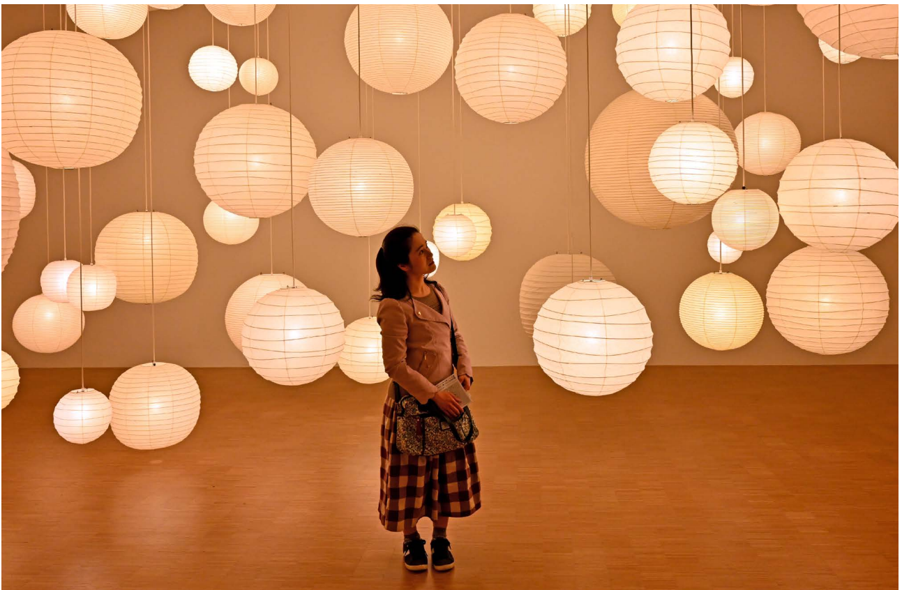
Exposition Isamu Noguchi, sculpter le monde au LaM à Villeneuve d'Ascq