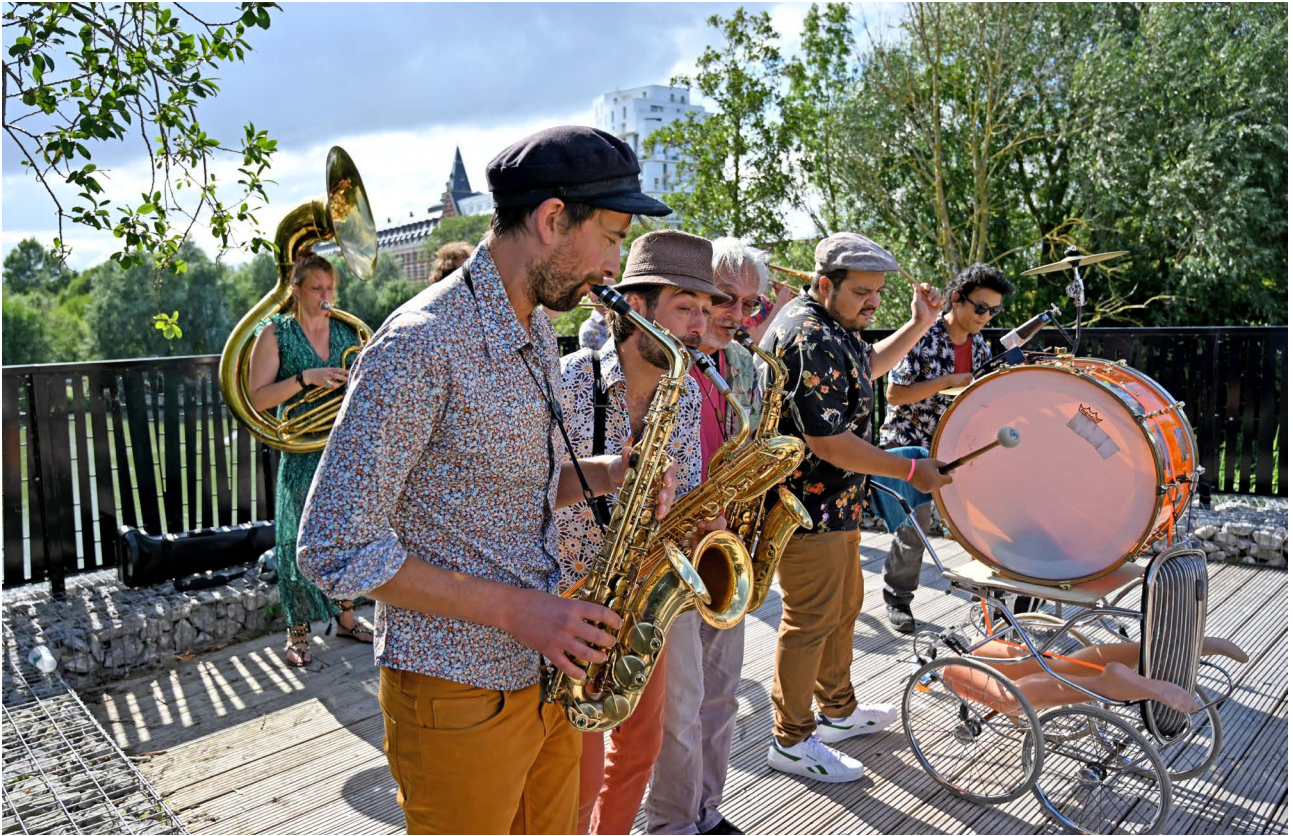
L'orchestre international du Vetex à Marquette-Lez-Lille - Belles sorties 2023