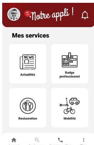
Visuel de la page d'accueil de « Notre appli »